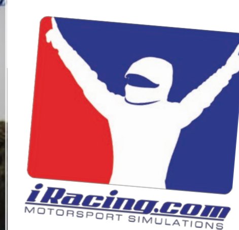
Earnhardt Jr re on line Al centro, Dale Earnhardt Jr mentre si allena con iRacing; il pilota Nascar collabora attivamente allo sviluppo del videogioco ed è un accanito simracer, con oltre 400 gare all'attivo; sotto, eccolo dominare una gara on line sulla sua Impala SS