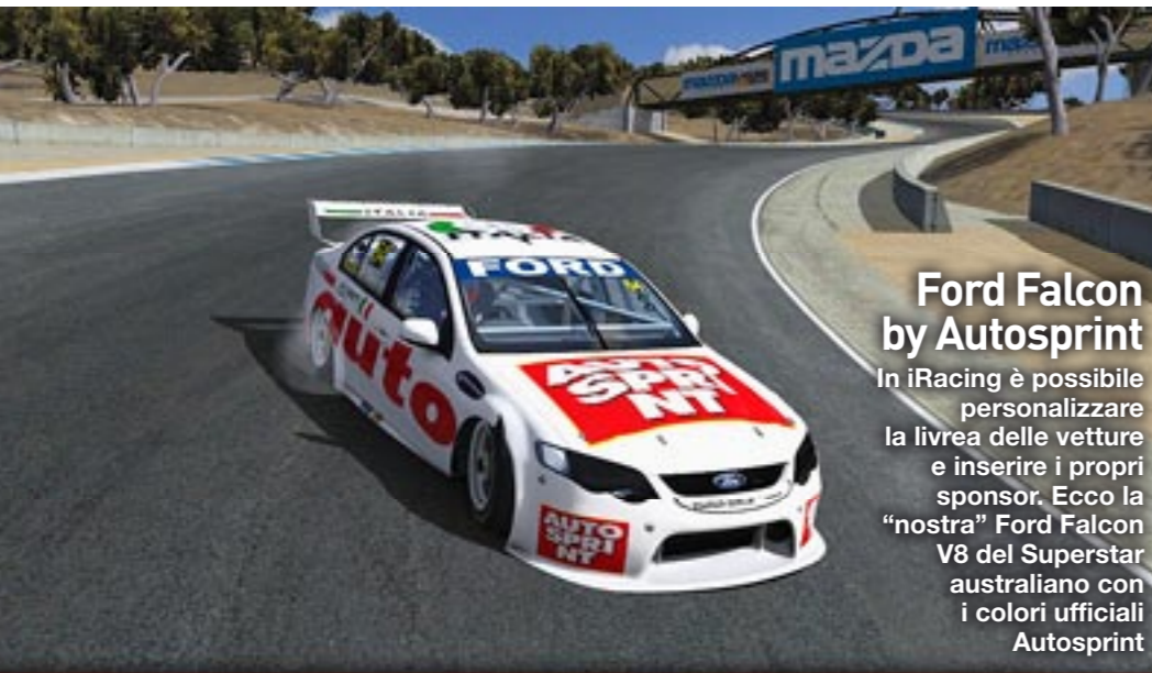
Ford Falcon by Autosprint In iRacing è possibile personalizzare la livrea delle vetture e inserire i propri sponsor. Ecco la "nostra" Ford Falcon V8 del Superstar australiano con i colori ufficiali Autosprint