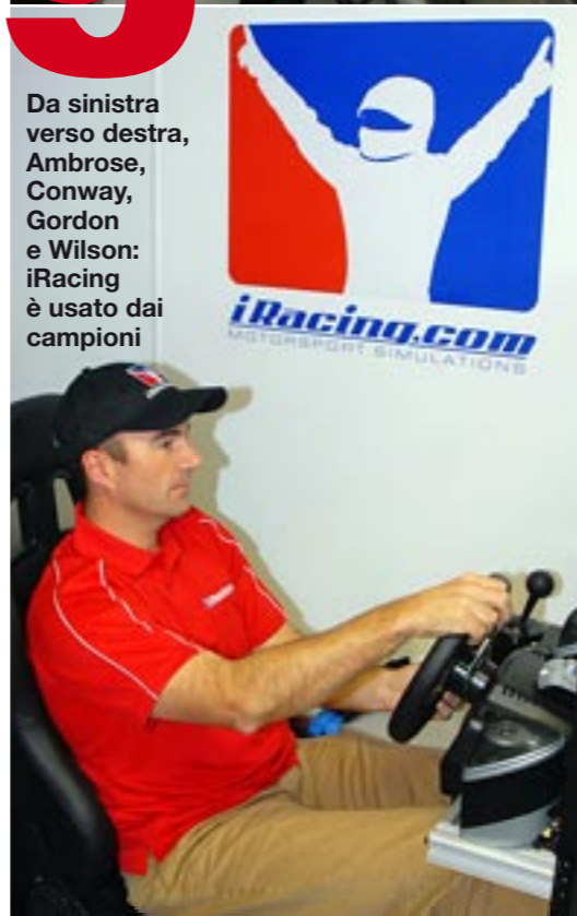
Da sinistra verso destra, Ambrose, Conway, Gordon e Wilson: iRacing è usato dai campioni

sario sottoscrivere un abbonamento, i cui costi li spieghiamo in dettaglio a parte. Una volta iscritti si potrà scaricare il software per iniziare la propria carriera di pilota virtuale: un pacchetto di tre vetture e otto tracciati e una bella patente "rookie", mentre tutte le altre auto e piste aggiuntive possono essere scaricate successivamente. A questo punto sta a voi buttarvi in pista, sfidare on line altri piloti (al momento oltre 20mila iscritti in tutto il mondo) e cercare di scalare la vetta per entrare in possesso di nuove licenze e correre nelle categorie superiori, dove troverete piloti con i "controbulloni" tra cui, come promesso in apertura, veri piloti come Dale Earnhardt Jr (il più accanito, ha all'attivo oltre 400 gare!), Bobby Labonte, Justin Wilson, Marcos Ambrose e altri ancora, che con iRacing ci giocano per davvero per divertimento e per allenarsi in vista delle competizioni reali. Fin qui, a parte la presenza dei campioni reali,